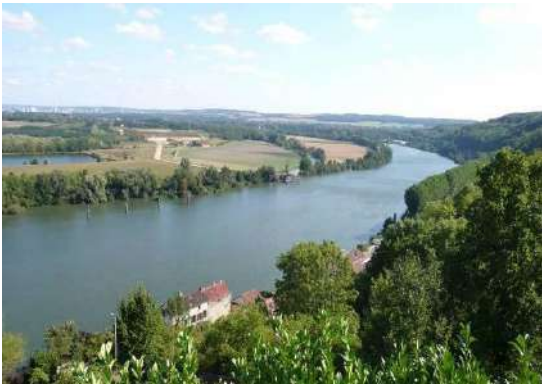
Figure 1 : Vue sur la boucle de Guernes depuis les coteaux de Rolleboise

Au cœur des méandres de la Seine (photo figure 1 ), la Zone de Protection Spéciale (ZPS) des « Boucles de Moisson, Guernes et forêt de Rosny » constitue un milieu naturel et humain original. Ce territoire, situé à l'interface des plateaux du Vexin et du Mantois, se caractérise par une richesse écologique et paysagère remarquable dont la Seine constitue la colonne vertébrale. La variété des milieux naturels, profondément marquée par plusieurs décennies d'extraction des granulats, est le support d'une forte diversité biologique.